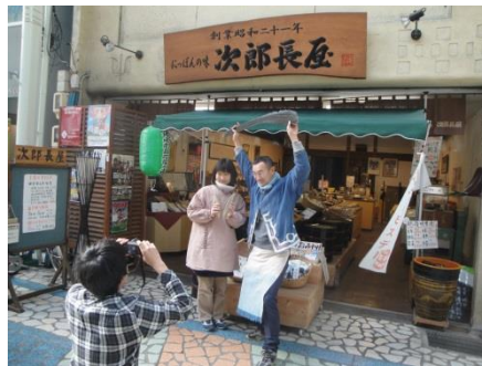
職業人図鑑づくり