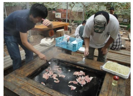
昼食もみんなで手作り 同じ鍋の飯を食べる仲です♪