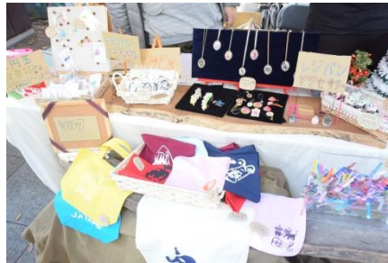
手作りの雑貨、アクセサリ ポストカードなど