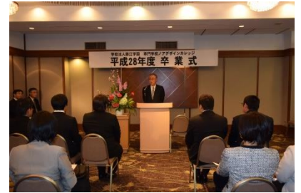
平成 28 年度卒業式 藤江学校長式辞

また4月には新入生を迎えます。3 期生のみなさんも、今度は先輩として活躍する場面が増えていきます。さらに、就職活動も始まります。積極的にチャレンジしていきましょう。