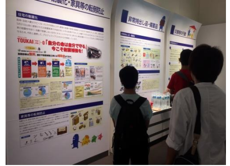
静岡県地震防災センターを訪問