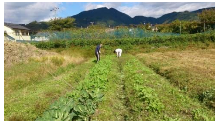
【環境】1年間自然農業に従事しました！