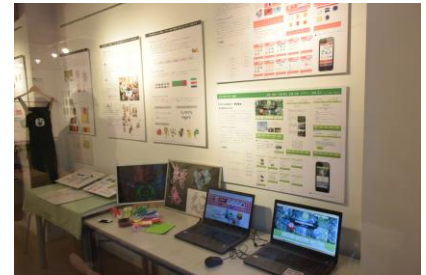
「学生展示会」を開催しました。

学生たちが制作した個性あふれる作品をギャラリーに展示しました。また今年度結成した軽音楽部による初ライブや交流会も開催し、学生、講師、保護者、卒業生などと共に、楽しいひと時を過ごしました。