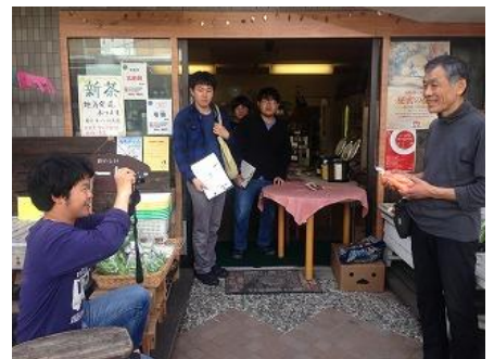
仕事人図鑑づくり