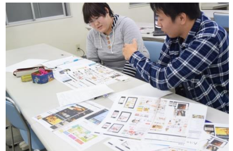
WEB デザイン企画実習