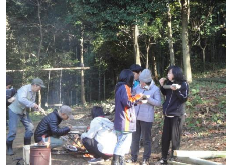
放置竹林の竹で食器を手作り&BBQ