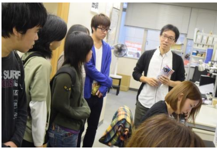
広告代理店シェイクラフト様を訪問