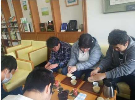
O-CHA プラザでお茶の入れ方の実習