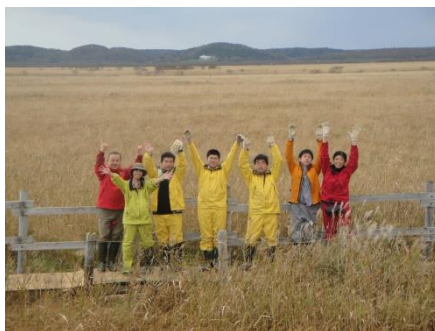
霧多布湿原での活動 (遊歩道補修ボランティア)