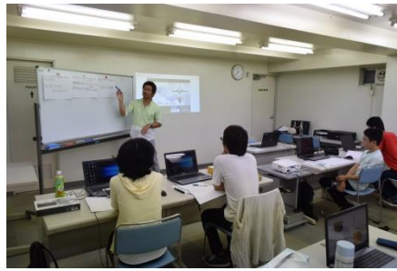
コピーライティング講座