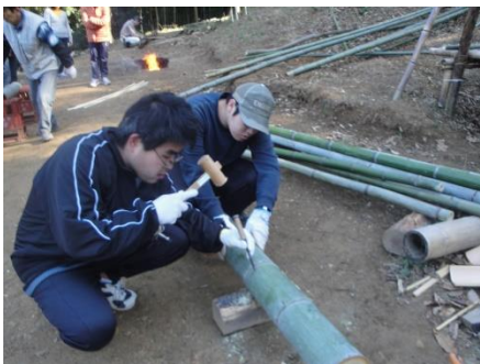
【環境】竹をくりぬいて炊飯鍋！