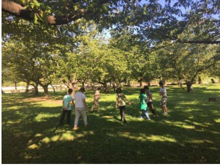
ネイチャーゲームの実践