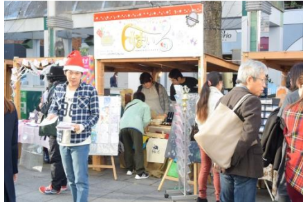
1・2年生で力を合わせて ディスプレイ♪

当日は、多くの方がブースにお立ち寄りくださいました。作品を手にしていただき、ありがとうございました！