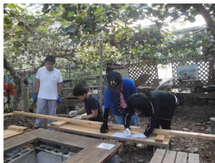
ベンチ作り チームワークよく仕上げました！