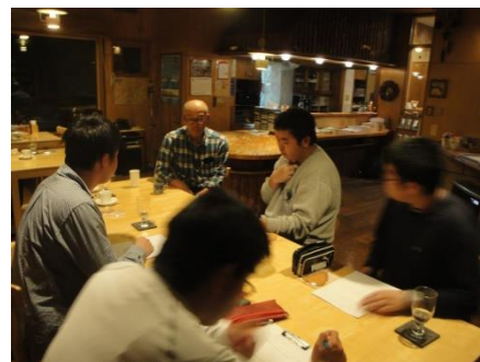
職業人インタビュー