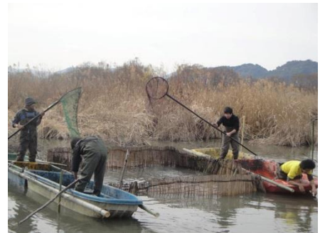
伝統漁法「柴揚げ漁」の伝承！