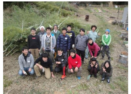
麻機での野外実習（最終登校日）