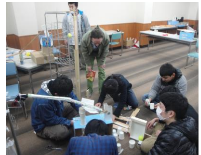
ピタゴラス装置づくり！！

多くの方がブースに立ち寄り、学生たちが制作したポストカードやしおりなどをお買い求めくださいました。ありがとうございました！