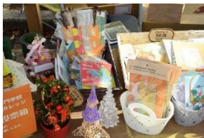
ポストカードなど

人間関係の豊かさは、人生の豊かさに直結すると言われます。ノアデザインカレッジでは、「教師－学生」といったタテの関係、そして友だち同士のヨコの間関係を育てていくことに加え、「先輩－後輩」のナナメの関係づくりを推進しています。