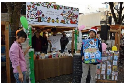
1・2年生で力を合わせてディスプレイ

ミニカーが風船を割ると、ビー玉が転がり出たり、重りが落ちた反動でゴム鉄砲の引き金が引かれたり、様々な仕掛けが連鎖していきます。全員で知恵を絞り、ひとつの大きなストーリーを完成させました。