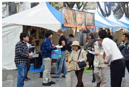
チラシ配り！積極的に PR しました。