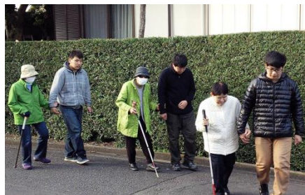
目の不自由な方の外出支援