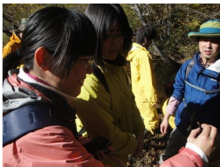
霧多布湿原エコツアー