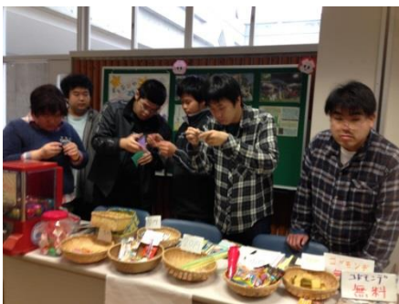
シンポジウムでのブース運営