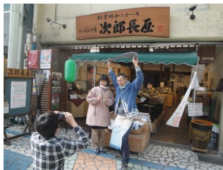
職業人図鑑づくり