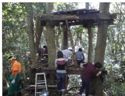
ツリーハウスづくり 樹木をいかに配慮をしています。