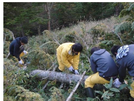
遊歩道整備ボランティア