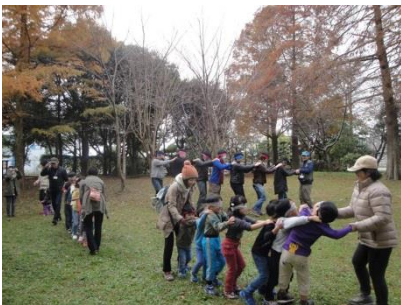
子どもたちのネイチャーゲーム イベント運営支援